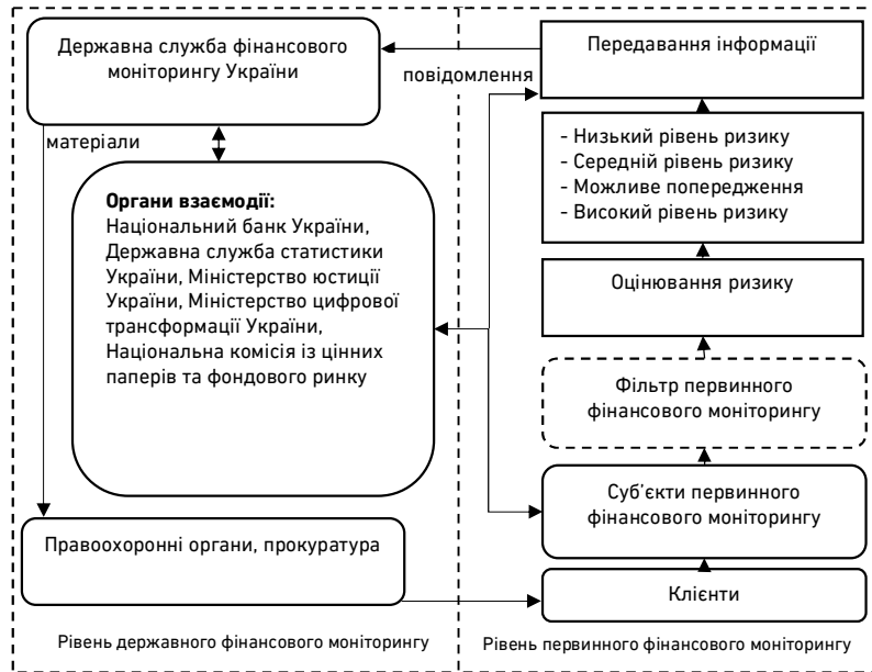
Рис. 2. Система функціонування фінансового моніторингу на первинному і державному рівні на основі ризик-орієнтованого підходу

Закон України «Про запобігання та протидію легалізації (відмиванню) доходів, одержаних злочинним шляхом, фінансуванню тероризму та розповсюдження зброї масового знищення» [8] визначає основні положення щодо порядку відстеження підозрілих фінансових операцій або діяльності, процедури подання інформації суб'єктами первинного фінансового моніторингу (СПФМ) до спеціального уповноваженого органу державного моніторингу. Проте, в умовах воєнного стану, коли посилюється увага до походження коштів, які можуть бути отримані незаконним шляхом, або бути пов'язаними із фінансування терористичних дій держави-агресора, діяльність у сфері фінансового моніторингу повинна бути адаптована до сучасних реалій та включати нові інструменти.