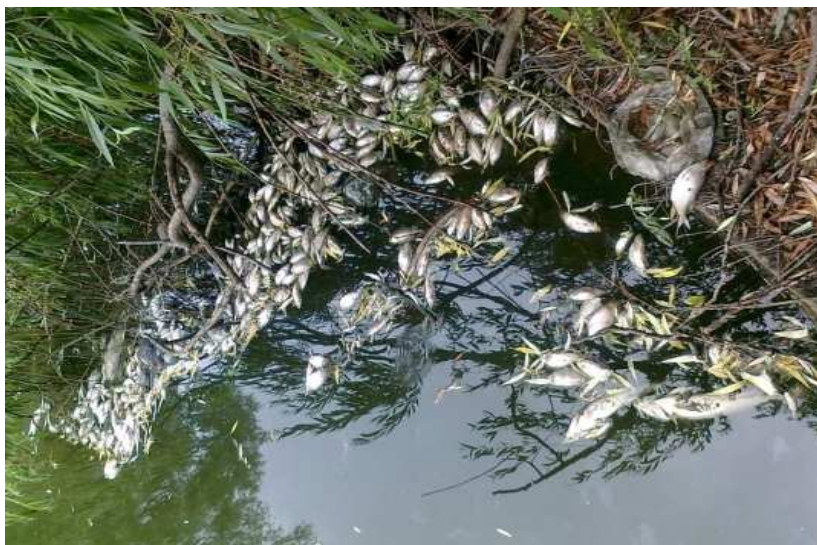
Рис. 3. Мертвая рыба на берегах р. Устье – результат замора 14-15 июня 2011 г.

1. Афанасьев С. А. Методика оценки экологических рисков, возникающих при воздействии источников загрязнения на водные объекты / С. А. Афанасьев. – Київ, 2004. – 60 с. 2. Відновна іхтіоекологія (реабілітація аборигенної іхтіофауни природних водоем України) / [за редакцією Й. В. Гриба, В. В. Сондака]. –