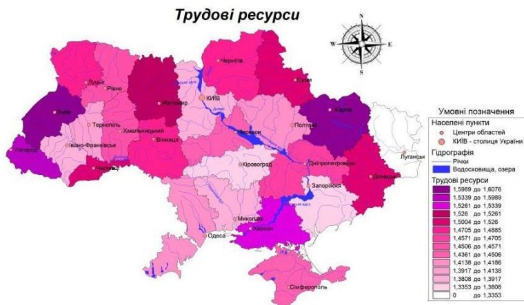
Рис. 1. Рейтинг регіонів України за їх трудовими ресурсами

Рейтинг регіонів України за їх трудовими ресурсами можемо спостерігати на рис. 1.