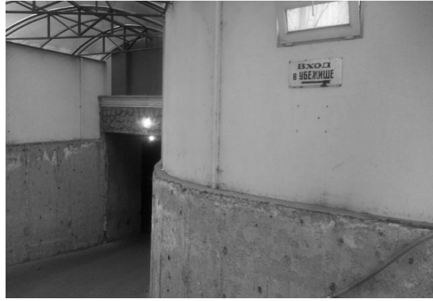
Рис. 2. Обозначение убежища в паркинге специальной табличкой «Вход в убежище» с направлением движения

Таким способом при вложении меньших средств можно обеспечить объект строительства достаточно современным и актуальным сооружением. Помимо уменьшения материальных затрат решается вопрос недостатка свободных площадей в условиях плотной городской застройки.