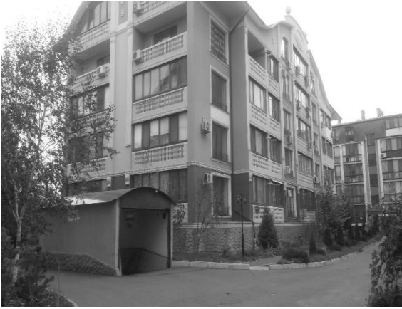
Рис. 1. Общий вид жилого малоэтажного здания с подземным паркингом в г. Одесса