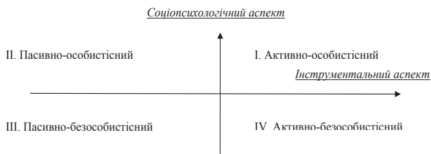
Рис. 1. Типи мотиваційного клімату [19]

є мотиваційний клімат на підприємстві. З цього приводу Дж. Пфеффер зауважує: «Створення приємної та стимулюючої атмосфери, яка дозволить працівникам проявляти свої здібності при виконанні професійних обов'язків, є дієвим засобом підвищення мотивації і продуктивності праці працівників. Створення таких умов може викликати труднощі і вимагати більш тривалий час, ніж звичайний вплив на працівників через важелі винагороди» [18, с. 15]. Сукупність умов, які впливають на мотиви працівників для досягнення цілей підприємства та їх особистих цілей являють собою мотиваційний клімат підприємства, який доцільно розглядати за чотирма типами (рис. 1).