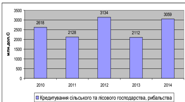
Рис. 2. Кредитування сільського, лісового господарств та рибальства МБРР і МАР у світі

Протягом 2010–2014 рр. МБРР та МАР надано кредити в галузі сільського, лісового господарства та рибальства на суму більше 13 млрд дол. США (рис. 2).