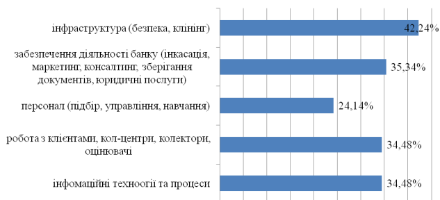
Рис. 1. Результати опитування банків-респондентів щодо найбільш доцільних видів аутсорсингу бізнес-процесів діяльності банків

Звертаючись до аналітичних матеріалів практиків банків, найбільш популярними щодо застосування аутсорсингу є інформаційні технології в банку та процесинг, організація роботи з клієнтами (звернення до колл-центрів, колекторів та оцінювачів забезпечення), забезпечення діяльності банків через проведення інкасації, маркетингу, консалтингу, бухгалтерії та зберігання документів, підбір, навчання та управління персоналом і забезпечення інфраструктури діяльності банку (безпека та клінінгові послуги) [8]. Так, за даними опитування сайту prostobankir.com.ua (рис. 1), у 2014 р. усе більшої популярності набувають види аутсорсингу, пов'язані з кредитним процесом банків, зокрема у сфері інформаційної безпеки (42,24% опитуваних), проведення роботи з клієнтами через організацію колл-центрів, колекторів та оцінювачів (34,48% респондентів) [8].