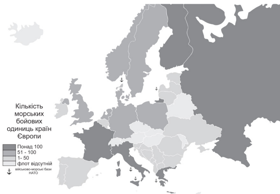
Рис. 2. Розподіл морських бойових одиниць по державам Європи (за [8])

З 44 європейських держав власні військово-морські сили у своєму розпорядженні мають лише 27 країн (рис. 2). Найпотужніший військовий флот сформувався в країнах Північної (Велика Британія, Фінляндія, Данія, Швеція, Норвегія), Південної (Італія, Греція, Іспанія) та Західної (ФРН, Франція) Європи, це, насамперед, пов'язано з історичними особливостями розвитку цих макро-регіонів [4]. Так, ВМС Росії є найчисельнішим серед всіх досліджуваних країн, нараховуючи 148 тис. осіб особового складу та близько 350 бойових кораблів та катерів (1143 «Кречет», 1144 «Орлан», 1164 «Атлант» та ін.); Фінляндія має другі за чисельністю ВМС в Європі, налічуючи 6 тис. осіб особового складу та 270 бойових морських машин («Раума», «Гельсінкі», «Кампела», «Куха» та ін.); військово-морські сили Італії налічують 34 тис. осіб регулярних військово-службовців та 143 бойові кораблі, структурно флот поділяється на 3 ескадри,