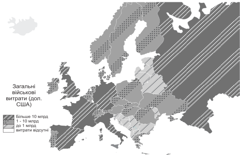
Рис. 1. Загальні військові витрати європейських держав (дол.) [8]

склали 20 % світових військових витрат (рис. 1). Згідно з даними Стокгольмського інституту дослідження проблем миру [6] за 2019 р. вони збільшилися на 2,8 % у порівнянні з 2018 р., але всього на 5,7 % порівняно з 2008 р. З початку 2019 р. військові витрати збільшилися в усіх макрорегіонах Європи. У Центральній і Східній Європі вони збільшилися на 2,4 % та 3,5 % відповідно, тоді як в Західній Європі вони піднялися лише на 2,6 %. У Східній Європі військові витрати за 2019 р. становили 67,7 млрд дол., збільшившись на 78 % у порівнянні з 2009 р. Слід зазначити, що значною мірою це сталося через зростання військових витрат Росії та її військово-політичної агресії. Навпаки, в Центральній Європі військові витрати в період з 2009 по 2019 р. збільшилися на 4,2 %, до 21 млрд дол., у той час, як у Західній Європі витрати за цей період зменшилися на 6,2 % (до 160 млрд дол. у 2019 р.).