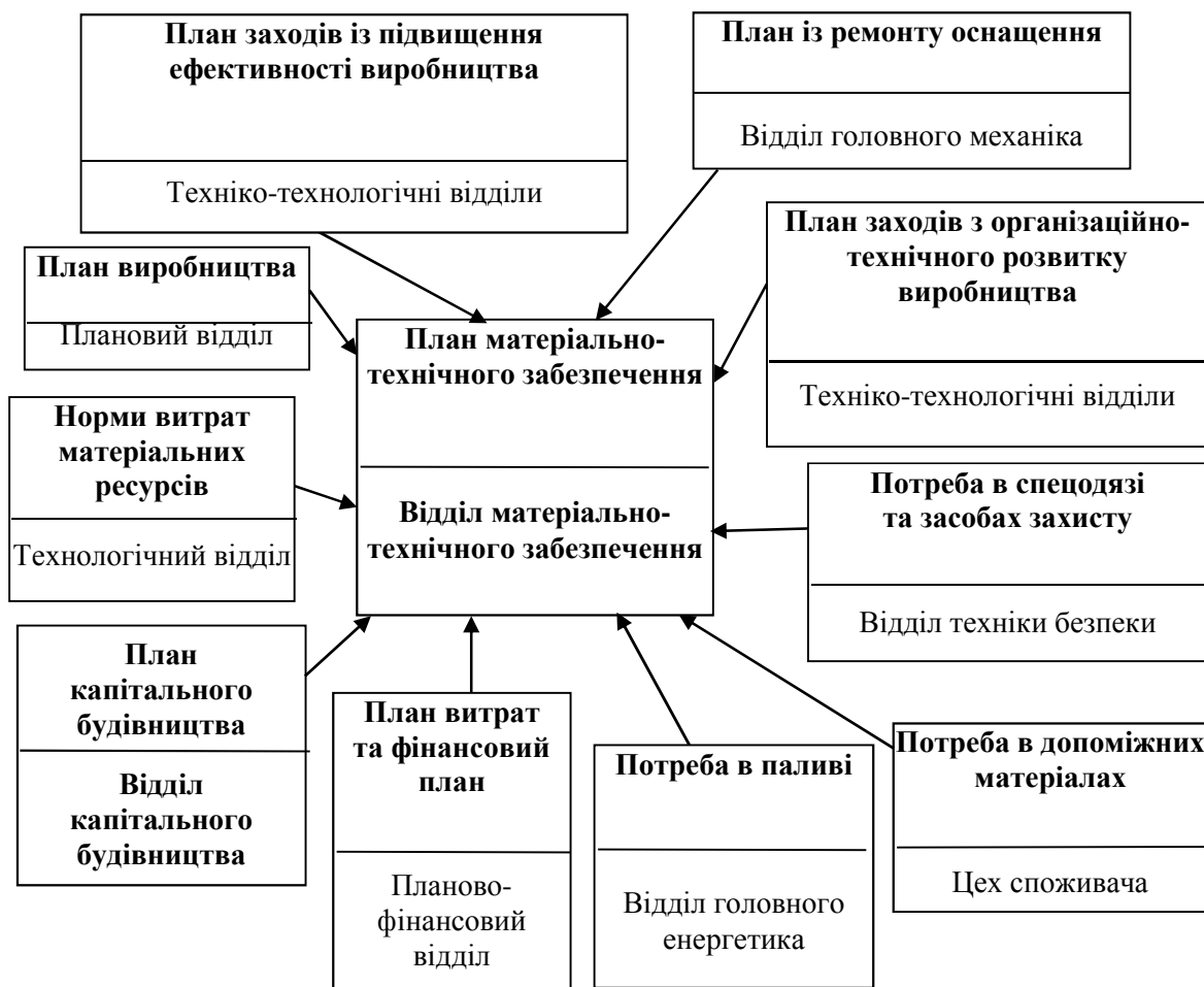
Рис. 1. Зв'язок плану матеріально-технічного постачання з іншими розділами плану діяльності підприємства

Виконуючи ці завдання службами матеріально-технічного постачання повинні враховувати співвідношення попиту та пропозиції на матеріальні ресурси, ціни на них, рівень запасів тощо.