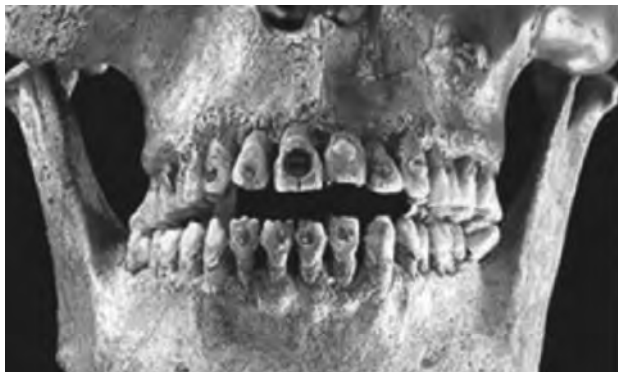
Рис. 3. Первісні прикраси зубів населення території сучасної Америки.

За даними National Geographic ще понад 2500 років назад прикрашення зубів існувало на території