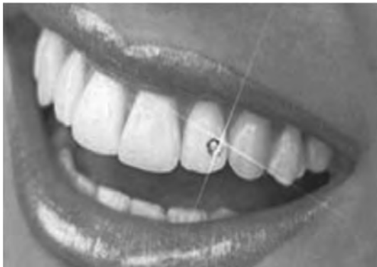
Рис. 6. а. Скайс на зубі 22.

Як правило, скайси мають розмір від 1,5 до 2,5 мм та товщину не більше 0,5 мм. На сьогодні форма скайсів відійшла від своєї первинної (камінець із 56 гранями), вона може бути як звичайним камінчиком ( рис. 6. а ), так і різною металевою фігуркою – твінкл ( рис. 6. б ). Скайси можуть мати конусну чи пласку