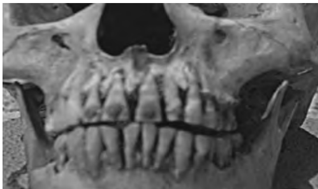
Рис. 2. Первісні прикраси зубів.

ми (3) (строк експлуатації 4-7 років) було обстежено з використанням наступних методів: карієс – маркування, термодіагностика, електроодонтодіагностика.