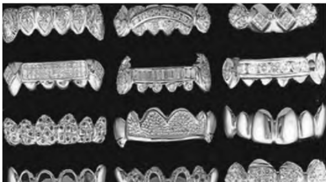
Рис. 7. Різновиди грізлів.