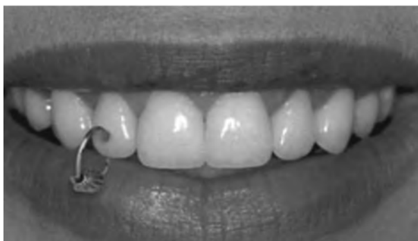
Рис. 11. Пірсинг зуба 12.

За даними огляду літератури ми порівняли стародавні та сучасні стоматологічні прикраси (табл. 2).