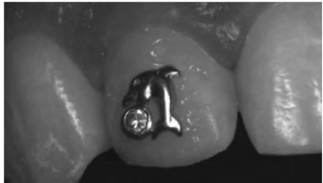
Рис. 6. б. Твінкл на зубі 12.

основу. Саме від цього залежить те, яким буде вибір методу фіксації, який ми розглянемо пізніше.