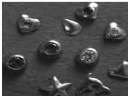
Рис. 8. Різновиди твінклів.

Татуювання зубів – метод прикрашання зубів шляхом нанесення перманентної фарби на тканини зуба або на спеціально підготовлену накладку (коронку) (рис. 9). Татуювання на зубах є тимчасовими і можуть зберігатися від доби до півроку, року, залежно від технології нанесення і використаних матеріалів. Для того щоб малюнок не стерся передчасно, не бажано часто їсти тверді овочі та фрукти, інакше малюнок татуювання може зіпсуватися і втратить свій сенс. Татуювання можна робити на здорових зубах за допомогою особливої перманентної фарби, яка акуратно наноситься на емаль зубів, а можна наносити візерунки тільки на попередньо виготовлену штучну накладку.