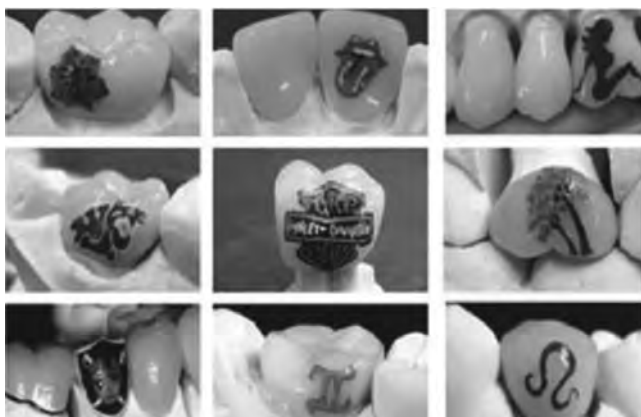
Рис. 9. Види татуювання зубів.

Твінкли – це різновид скайсів, що являє собою фігурку із металу, що інкрустована камінням (рис. 8). Ця прикраса з'явилась пізніше за стандартний скайс і вважається прикрасою «нового покоління».