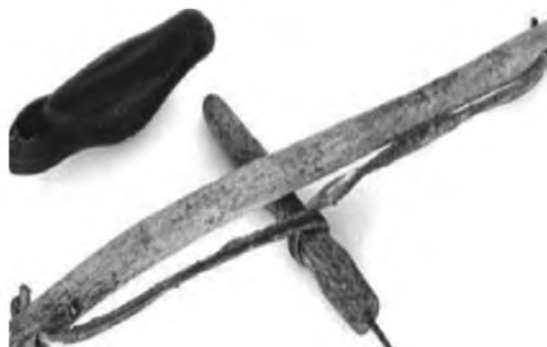
Рис. 1. Первісні стоматологічні інструменти.

15 дорослих пацієнтів та 2-х дітей із раніше встановленими скайсами (8), стразами (4+2) та твінка-