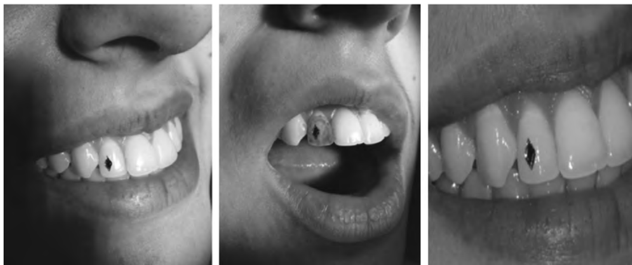
Рис. 12. Зуб 12 до-, на етапі та після проведення карієс-маркування.