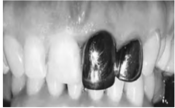
Рис. 5. Штучні коронки із золота.

2. Для чищення міжзубних ділянок використовувати флос;