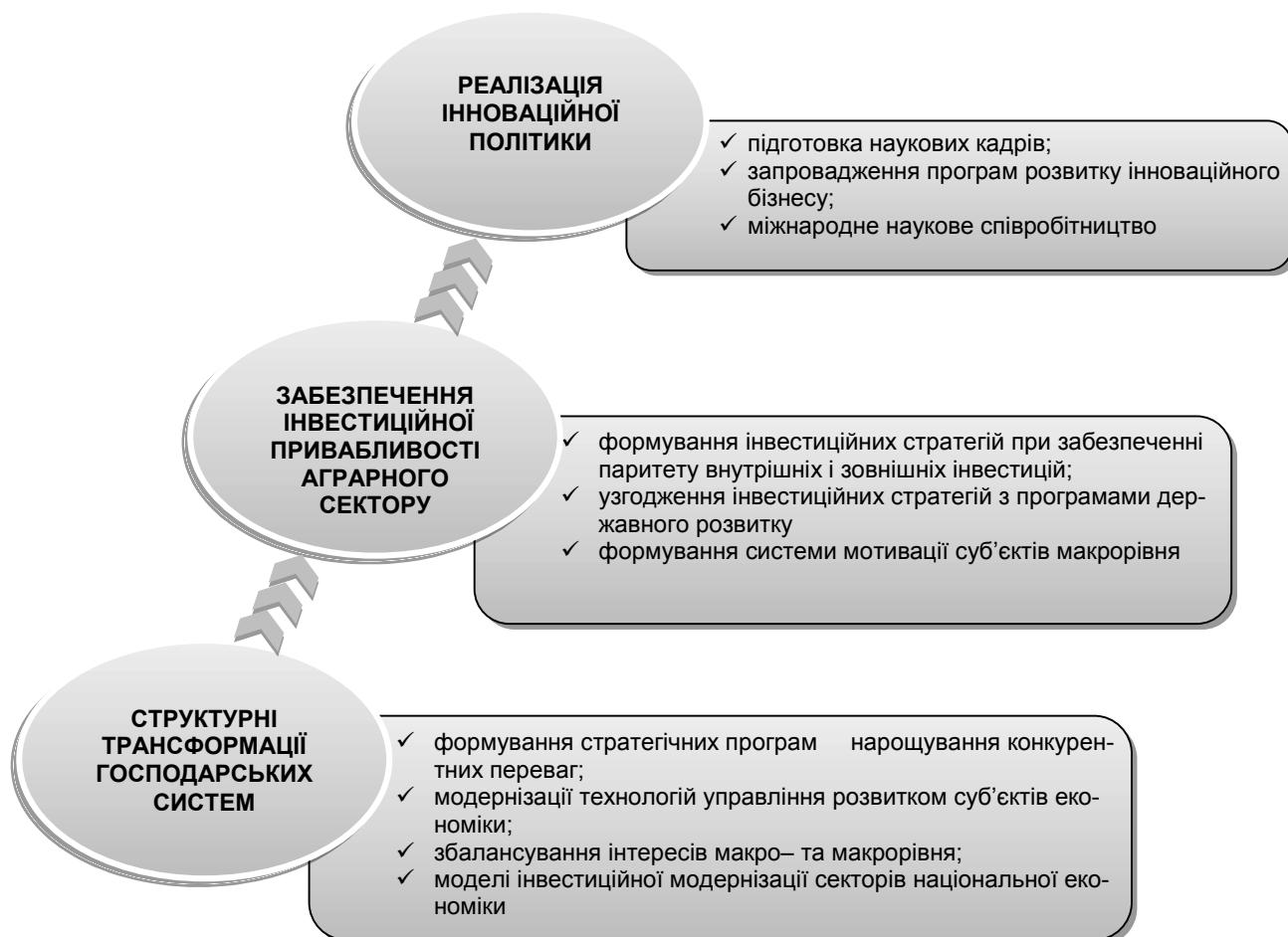
Рис. 3 Напрями формування та реалізації конкурентоспроможного розвитку аграрного сектору економіки

рентоспроможного розвитку слід визначити базові напрями їх реалізації (рис. 3).