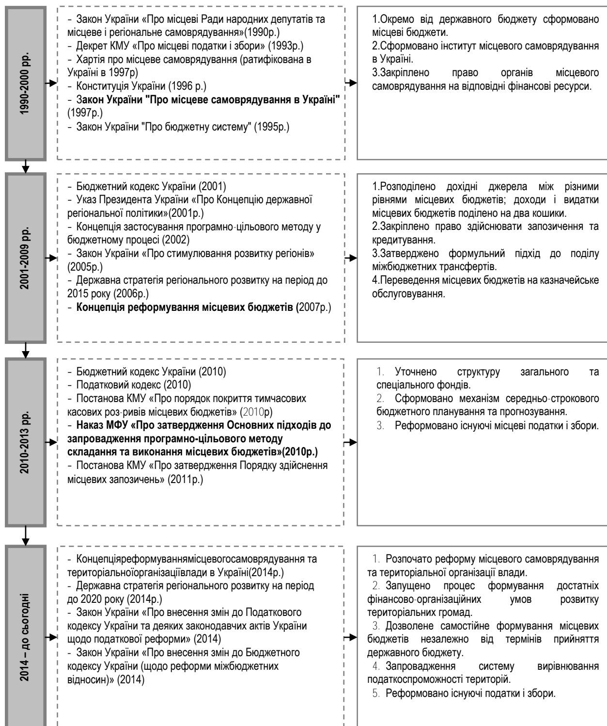
Рис. 1. Періодизація розвитку системи місцевих бюджетів в умовах незалежності України