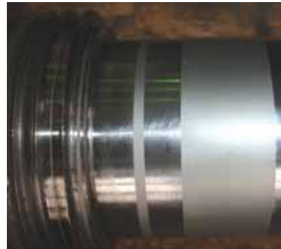
Рисунок 13 - Следы электроэрозии на шейке ротора КВД в месте установки опорного подшипника и его уплотнения

В связи с этим было произведено размагничивание в выше указанных местах, после чего значение индукции магнитного поля составило от минус 2 до +4 Гс, что соответствует нормам.