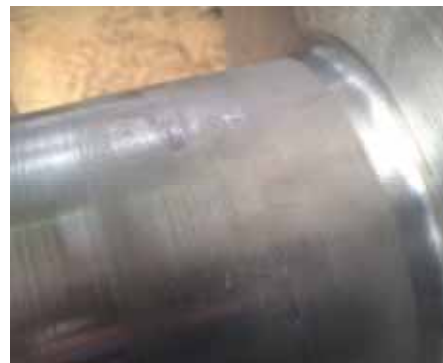
Рисунок 10 - Следы электроэрозии на шейке ротора турбины