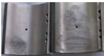
Рисунок 3 - Электроэрозионное разрушение опорных колодок подшипника