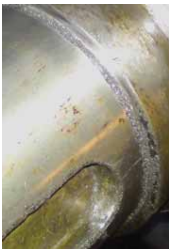
Рисунок 7 - Электроконтактная эрозия шпоночного паза

При ревизии ротора компрессора 4VRM 200/490 ОАО «Лукойл-ОНПЗ» были обнаружены сильные электроэрозионные повреждения шпоночного паза и кольцевая борозда в месте упорного бурта на посадочной поверхности под полумуфту. Для устранения данных повреждений шпоночный паз был расширен и установлена переходная шпонка, а в месте кольцевой борозды был выполнен плавный переход по радиусу с заглублением в тело ротора (рис. 7, 8).