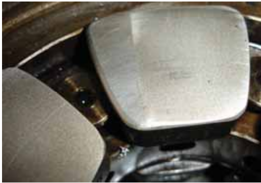
Рисунок 12 - Электроэрозионное разрушение упорной поверхности опорно-упорного подшипника турбины