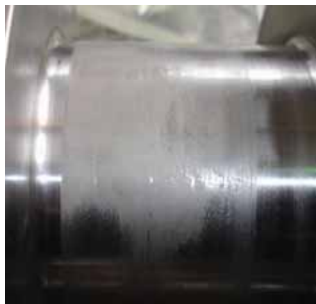
Рисунок 5 - Следы электроэрозии на шейке ротора