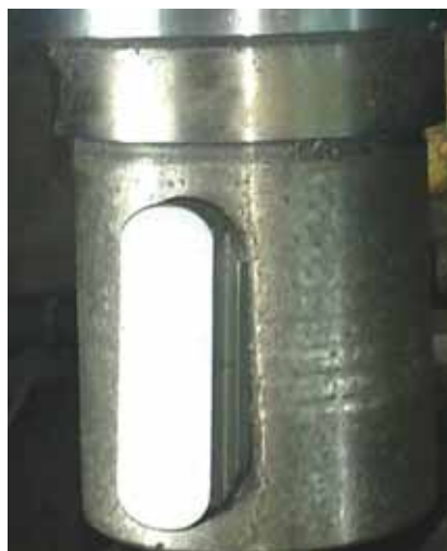
Рисунок 8 - Устранение последствий электроэрозии

На компрессоре технологического воздуха поз.101-Ж цеха Аммак-3 ОАО «Гродно Азот» при