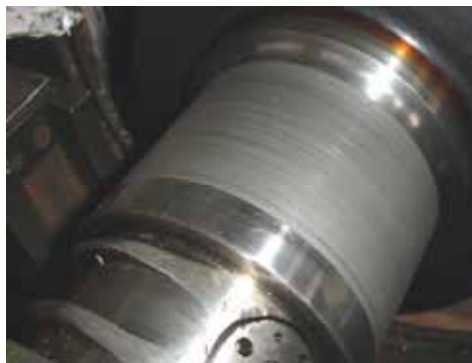
Рисунок 9 - Следы электроэрозии на шейке ротора турбины

3. Торцов свободных концов вала зубчатого колеса и вал-шестерни от минус 26 до +23 Гс (также видны следы точечной коррозии в местах с наибольшим значением МИ).