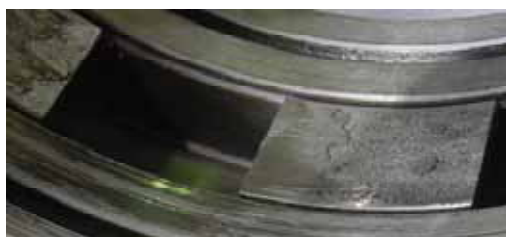
Рисунок 2 - Электроэрозионный износ опорных колодок плавающего уплотнения

Основным способом размагничивания является воздействие на деталь знакопеременного магнитного поля с плавно убывающей до нуля амплитудой. Размагничивание – процедура, позволяющая уменьшить остаточную намагниченность образца до таких значений, когда ею можно пренебречь.