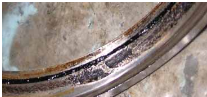
Рисунок 6 - Отложения масляного кокса и электрохимическая коррозия на уплотнительном кольце «масло-газ»