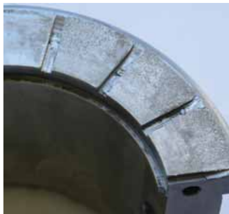
Рисунок 4 - Электроэрозионное разрушение опорной поверхности опорно-упорного подшипника