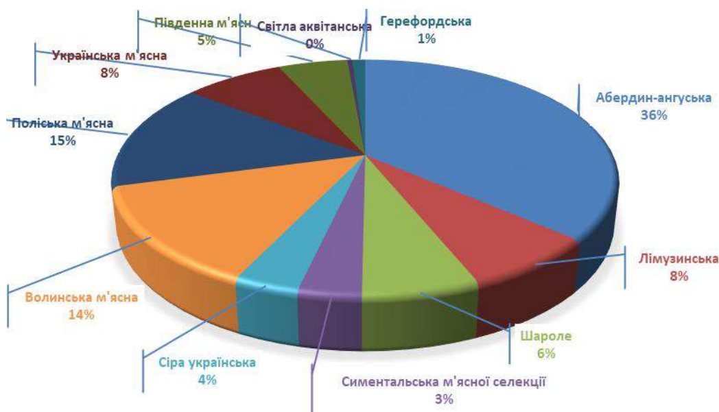
Рис. 2. Питома вага племінної великої рогатої худоби м'ясного напрямку продуктивності вітчизняних та імпортованих порід

Лімузинська порода є четвертою за представництвом серед зарубіжних селекційних досягнень м'ясного напрямку продуктивності. Загальна чисельність племінного поголів'я цієї породи становить 1909 гол., у 4 племінних підприємствах, з них у племінних заводах 955, у племрепродукторах 954 гол. Породу лімузин розводять в 2 племінних заводах "ТОВ "Агрікор Холдинг", СТОВ Ратнівський аграрій, в 2 племрепродукторах ТОВ "Баффало", ФГ "Велес".