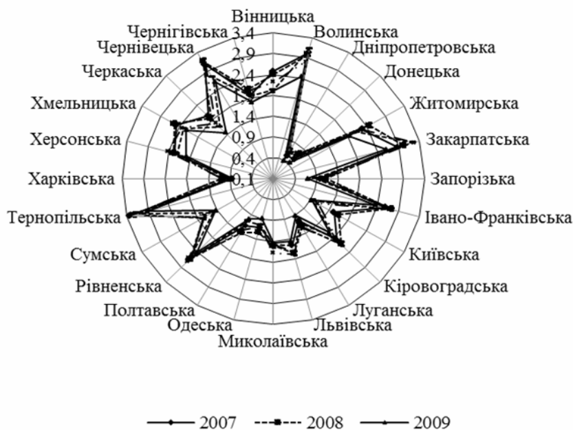
Рис. 2. Динаміка співвідношення доходів місцевих бюджетів та міжбюджетних трансфертів в Україні протягом 2007-2011 рр. [2]

Спостерігається значне перевищення питомої ваги залучених коштів над власними ресурсами для переважної більшості областей України. До бюджетів, структура яких визначається перевищенням частки трансфертів протягом 2007-2011 рр., слід віднести Вінницьку, Волинську, Житомирську, Закарпатську, Івано-Франківську, Кіровоградську, Рівненську, Тернопільську, Херсонську, Хмельницьку, Чернівецьку та Чернігівську області. Найбільший рівень дотаційності серед досліджуваних обласних бюджетів спостерігається в Тернопільській області.