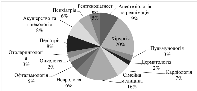
Рис. 1. Структура лікарського персоналу у Польщі за вузькими спеціалізаціями станом на 2019 рік

окремими польськими і зарубіжними медичними закладами, в тому числі за сприяння регіональних органів управління та самоврядування.