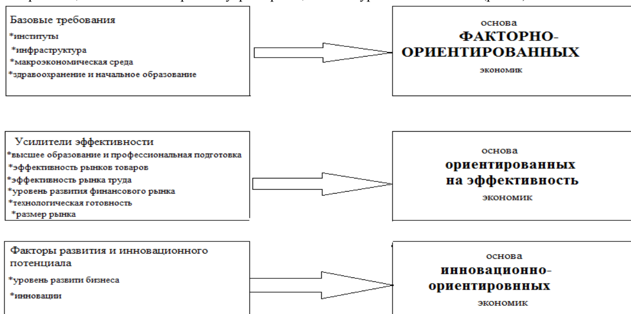
Рис. 1. Факторы конкурентоспособности**.

Для изучения конкурентоспособности страны в целом необходимо изучить 12 факторов конкурентоспособности (рис. 1).