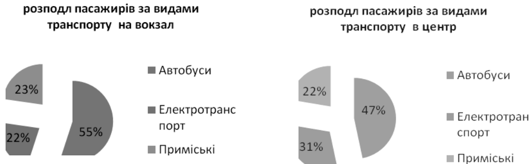
Рис. 2. Розподіл пасажирів за видами транспорту по вул. Київська у процентах (8.00–9.00)

На рисунку 2 бачимо розподіл пасажирів в прямому і зворотному напрямках, по основній магістральній вулиці м. Житомира – Київській – у процентному співвідношенні.