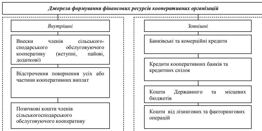
Рис. 3. Джерела мобілізації фінансових ресурсів сільськогосподарськими обслуговуючими кооперативами