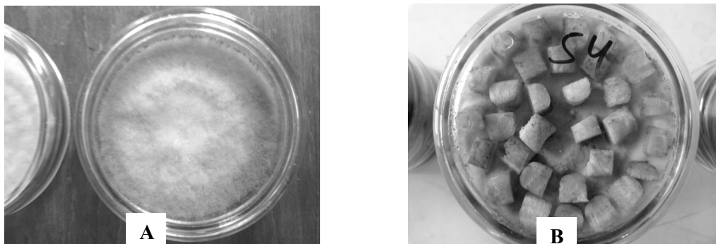
Рис. 1. Визначення стійкості буряків до гнилей коренеплодів:

Зразки для проведення оцінки стійкості гібридів цукрових буряків до фузаріозної гнилі коренеплодів відбирали в умовах Уладово-Люлінецької дослідно-селекційної станції (УЛДСС) ІБКЦБ НААНУ та на демонстраційних посівах агропромхолдингу «Астарт-Київ».