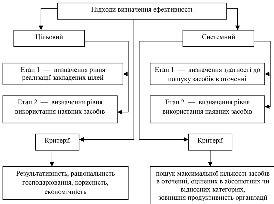
Рис. 1. Характеристика підходів до оцінки ефективного виробництва картоплі