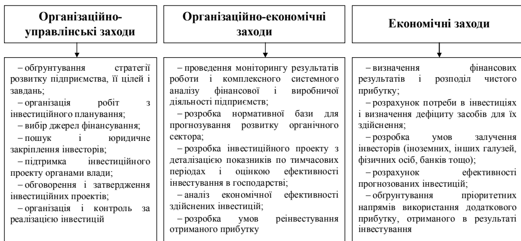
Рис. 3. Основні заходи активізації інвестиційної діяльності в органічному сільському господарстві

Отже, аналіз чинників, що впливають на розвиток органічного виробництва в Україні, дозволяє стверджувати, що більшості з них має більш стримуючий, ніж стимулюючий характер. Для усунення негативної дії цих факторів вважаємо за потрібне розробити Програму розвитку виробництва органічної сільгосппродукції в Україні на період до 2020 року, яка містила б комплекс відповідних заходів. Серед таких заходів обов'язковим має бути залучення додаткових інвестицій та посилення інвестиційного процесу в органічному сільськогосподарському виробництві (рис. 3).