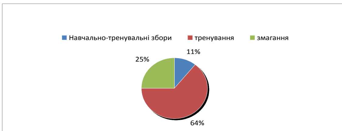
Рис. 2. Розподіл травм за складовими спортивної підготовки (%).

При аналізі розподілу травм за складовими спортивної підготовки (рис. 2) встановлено, що під час навчально-тренувальних зборів травмувалися 11% респондентів, під час змагань – 25%, під час тренування – 64%. Розбіжність триманих результатів з даними інших дослідників, на наш погляд, можна пояснити невеликою загальною кількістю студентських змагань. У розрізі тренувального заняття найбільшою виявилася кількість травм, отриманих спортсменами в основній частині (78,8%).