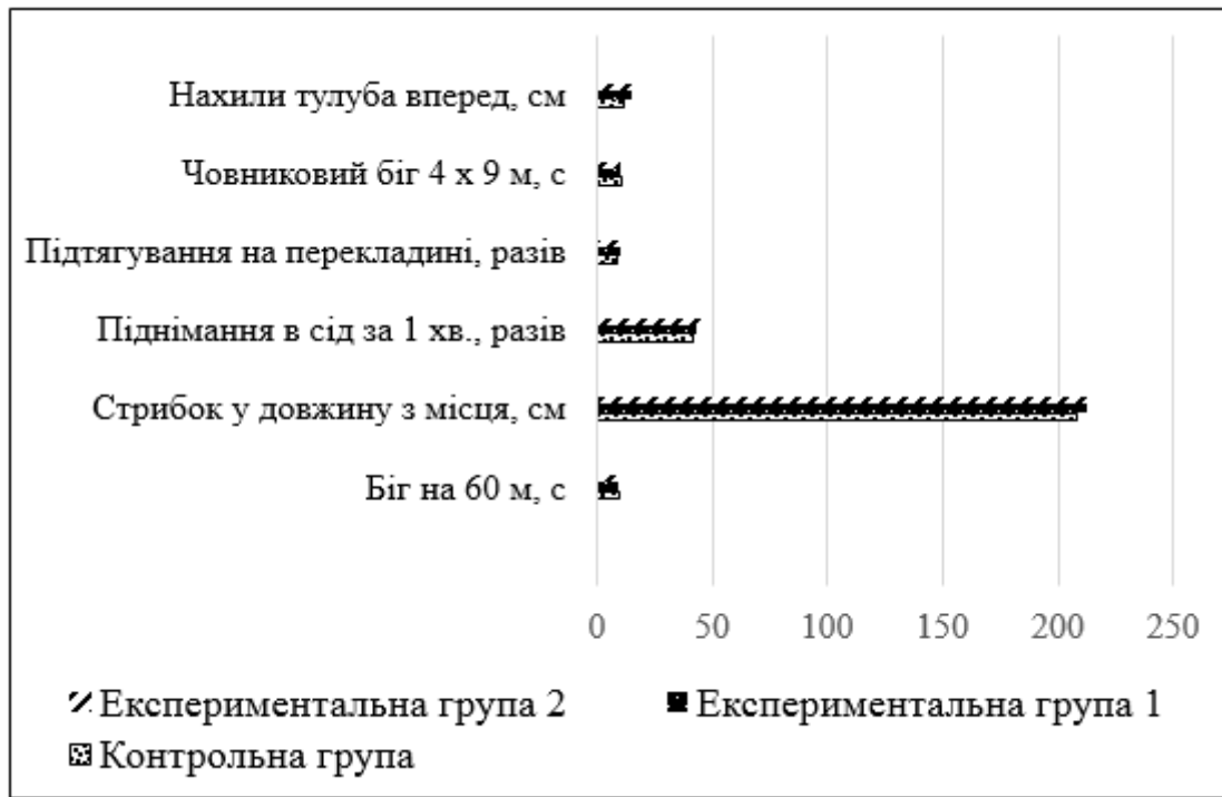
Рис. 2. Показники фізичної підготовленості хлопчиків 6-х класів у кінці дослідження

Показники фізичної підготовленості школярів контрольної та експериментальної групи з секції баскетболу статистично відрізнялися за тими самими тестами: підтягування на перекладині, човниковий біг 4 x 9 м, нахил тулуба. При порівнянні двох експериментальних груп статистично значимої різниці не спостерігалось за жодним тестом. Слід зауважити, що в кінці дослідження середньостатистичні значення рівня розвитку показників фізичної підготовленості школярів, які відвідують секційні заняття з волейболу та баскетболу, класифікувалися як високі. У контрольній групі за всіма показниками визначено рівень вищий за середній, крім показника стрибок у довжину.