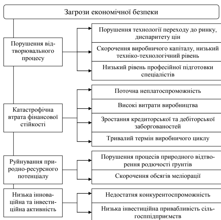
Рис. 1. Загрози економічній безпеці і причини їх виникнення

У процесі визначення загроз економічної безпеки необхідно дослідити порушення відтворювального процесу; встановити погрози втрати фінансової стійкості та руйнування природно-ресурсного потенціалу і причини низької інноваційної та інноваційної активності сільськогосподарських підприємств (рис. 1).