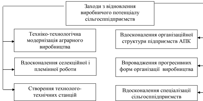
Рис. 2. Зниження рівня загрози «порушення відтворювального процесу»

Встановлено необхідність розробки заходів щодо зниження рівня загроз «порушення відтворювального процесу» сільськогосподарських підприємств (рис. 2). У схемі зниження рівня загрози «порушення відтворювального процесу» запропоновано заходи по відновленню виробничого потенціалу сільськогосподарських підприємств.