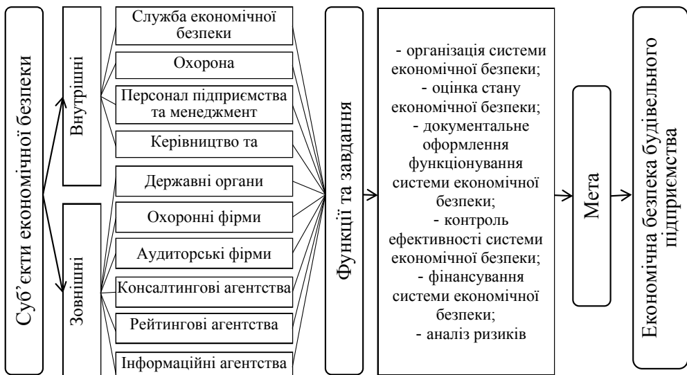
Рис. 2. Суб'єкти системи економічної безпеки будівельних підприємств

Основними об'єктами системи економічної безпеки будівельного підприємства вважаються: інформація, персонал, фінансова сфера тощо. Класифі-