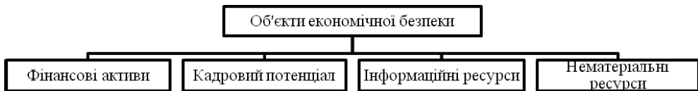
Рис. 1. Об'єкти захисту в системі економічної безпеки