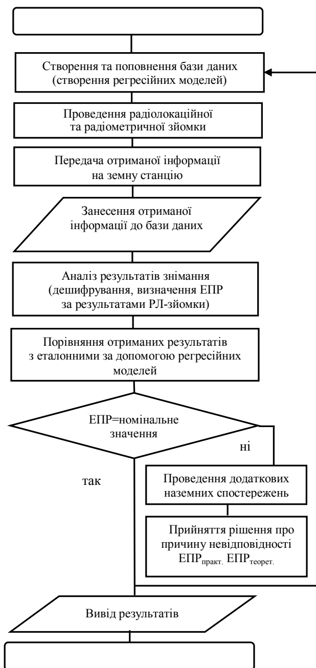
Рис. 2. Схема алгоритму функціонування РГМЗП