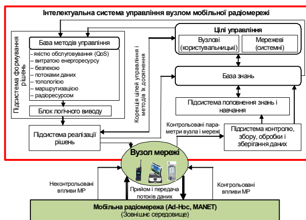
Рис. 1. Узагальнена модель інтелектуальної системи управління вузлом МР

В [6 – 8] запропонована низка „інтелектуальних” методів управління ресурсами МР, використання яких передбачається в різних функціональних підсистемах вузлової СУ.