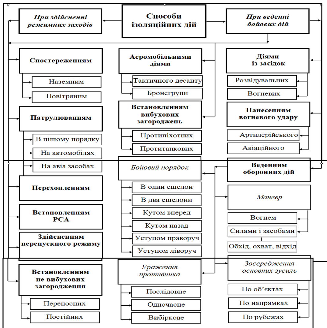
Рис. 3. Способи ізоляційних дій військ

В боротьбі з НЗФ, які діють партизанськими методами, способи дій не мають бути "шаблонними", що вимагає розроблення нових положень в тактиці військ.