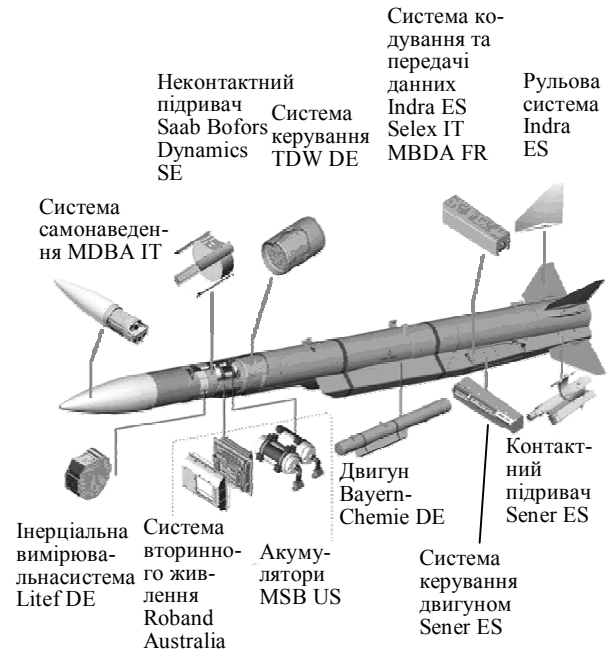
Рис. 1. Компоновка ракети і виробники окремих систем

ність необхідності використання спеціалізованого літака РЕБ, на відміну від американської PPP HARM. PPP ALARM можуть бути розміщені на будь-якому Торнадо GR4 (з 2003 року і на Торнадо F3). Військовій авіації, яка використовує HARM, доведеться застосувати спеціалізовані літаки РЕБ, наприклад, варіант Торнадо ECR для Німеччини, Італії і F-16 CJ – США.