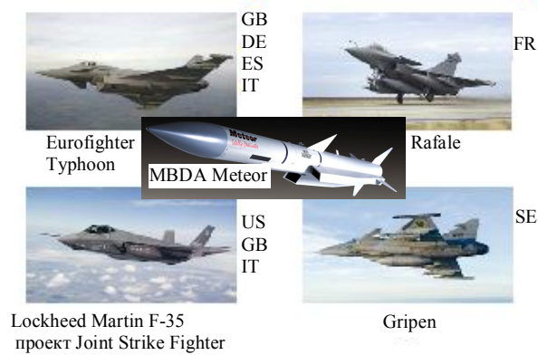
Рис. 2. Потенційні носії ПРР Meteor

Окрім цього, істотно підвищується швидкість ПРР, практично в два рази (4 М), в порівнянні з ПРР HARM. Слід зазначити, що двигун Meteor працює на всій траєкторії руху, на відміну від традиційної схеми "розгін - кінетичний політ". Наявність постійної тяги припускає істотне збільшення дальності дії (S) і велику "динамічну" зону, оскільки ракета може маневрувати набагато більшу частку маршруту без програшу в швидкості (V) і кінетичній енергії (рис. 3).