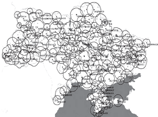
Рис. 1. Покриття території України станціями цифрового телебачення

Вже зараз на території країни можливо здійснювати прийом сигналу цифрового ефірного телебачення (далі: цифровий сигнал) завдяки впорядкованому розміщенню пристроїв випромінювання цифрових сигналів – мультиплексорів, з радіусом покриття від 25 до 110 кілометрів в залежності від рельєфу місцевості та місця розміщення мультиплексора на місцевості, що забезпечує достатнє покриття території країни (рис. 1) [3–4].