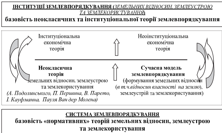
Рис.1 Теоретичні складові зростання сутності землевпорядкування від «Системи» до «Інституції» (гіпотеза дослідження)

Саме рух землеустрою та землевпорядкування від однієї із функцій управління земельними ресурсами до більш вагомшого і самостійнішого явища в економіці та екології яке обґрунтовує інституціонально-поведінкова теорія землеустрою та землевпорядкування. У рамках нормативних теорій наявний на практиці розвиток соціально-економічної сутності землеустрою та землевпорядкування не пояснюється, та більше того, обмежується теоретичними догмами. Застосувавши методи аналізу та синтезу до розгляду сучасного землеустрою та землевпорядкування як суспільного явища, ми прийшли до висновків, що землевпорядна наука відповідає всім теоретичним ознакам соціально-поведінкової науки в цілому, так і економічної інституції зокрема.