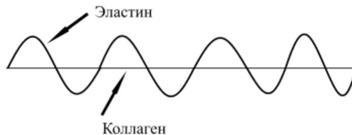
Рисунок 1 – Расположение эластина и коллагена в микромеханической модели [9]

В работе [8] с помощью методов статистической механики был получен закон конечных деформаций для кожи как для ортотропного нелинейного материала с пятью необходимыми материальными константами: плотность молекулярных цепей, три отношения сторон минимальной показательной ячейки и модуль объемного сжатия. Численные решения уравнений состояния проводились методом конечных разностей.