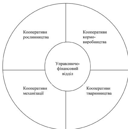
Рис. 2. Горизонтальна схема формування виробничого кооперативного об'єднання

Кооперативні підприємства, як прояв вищої форми сільськогосподарської кооперації, формуються в умовах кризового стану економіки. Проте розвиток кооперації повинен мати певні передумови політичного, соціального, економічного, психологічного та юридичного характеру. Створення кооперативів було відповіддю на зростання агресивності ринкового середовища.