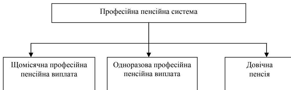
Рис. 2. Види пенсійних виплат за рахунок коштів професійної пенсійної системи [6]

Роботодавець сплачуватиме пенсійні внески до професійної системи протягом усієї тривалості роботи працівника в шкідливих та важких умовах праці та на роботах, виконання яких дає право на пенсію на пільгових умовах чи за вислугу років. Ці внески будуть власністю робітника, тобто роботодавець за жодних умов не зможе їх забрати. Накопичені кошти в сукупності з інвестиційним доходом становитимуть суму, яка може бути використана для здійснення професійних пенсійних виплат, що зображено на рис. 2 [6].