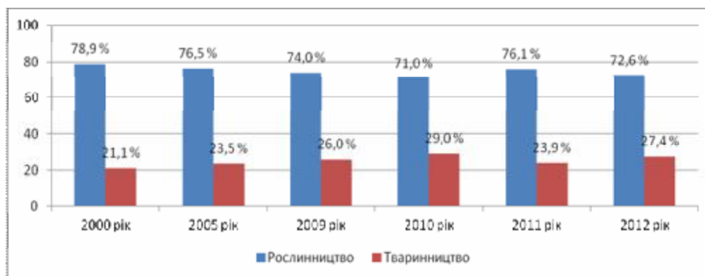
Рис. 2. Динаміка співвідношень часток галузей аграрного сектору в структурі валової продукції сільського господарства Миколаївської області [7, с. 11]

В цілому результати діяльності аграрного сектора формуються за підсумками операційної діяльності підприємств за галузями рослинництва та тваринництва, які в Миколаївській області розвиваються нерівномірно, маючи в основі певні проблеми, що спровоковані структурною непослідовністю та безсистемністю механізмів регулювання діяльності. Домінування рослинницької галузі залишається фактичним протягом останніх десятиріч, що знову ж таки спровоковано високим ступенем розораності, природо-кліматичними умовами та складовими економічної доцільності функціонування галузей на підставі державного та ринкового механізмів регулювання. З року в рік акцент в функціонуванні аграрного сектору здійснюється саме на розвиток галузі рослинництва, що підтверджується даними рис. 2.