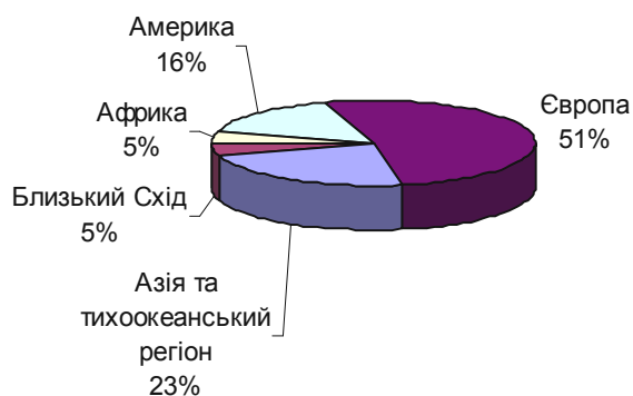
Рис. 1. Розподіл в'їзного міжнародного туризму за туристичними регіонами, 2013 рік [9]

регіон також займає 5 % у регіональному розподілі міжнародного ринку туристичних послуг. Географічний розподіл зображено на рис. 1.