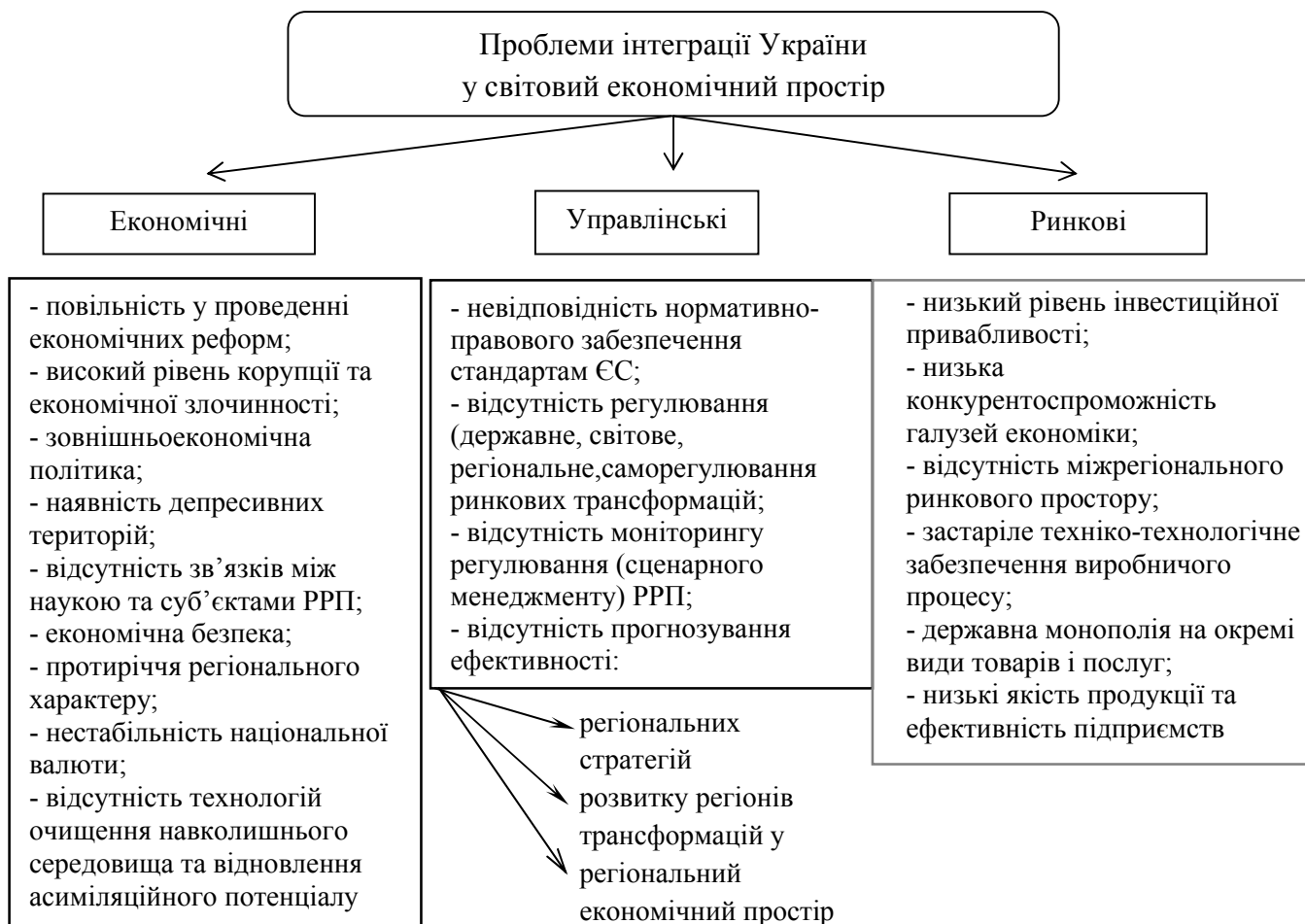
Рисунок 1 – Проблеми інтеграції України у світовий економічний простір