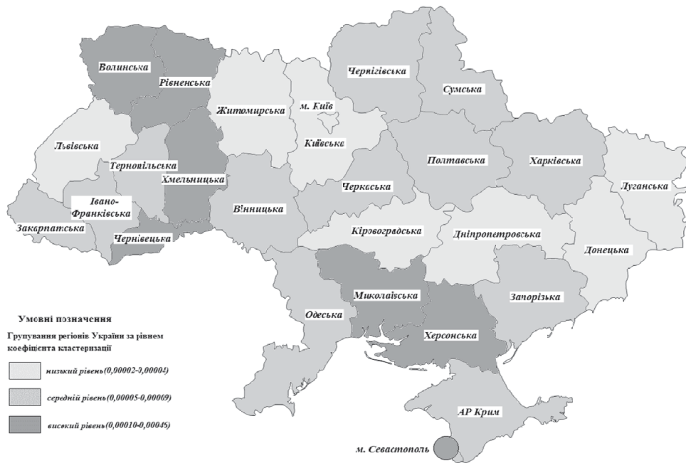
Рис. 3. Групування регіонів України за рівнем коефіцієнта кластеризації