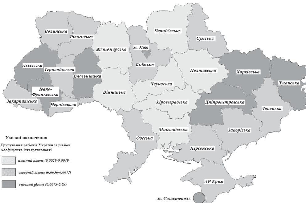
Рис. 4. Групування регіонів України за рівнем коефіцієнта інтегративності