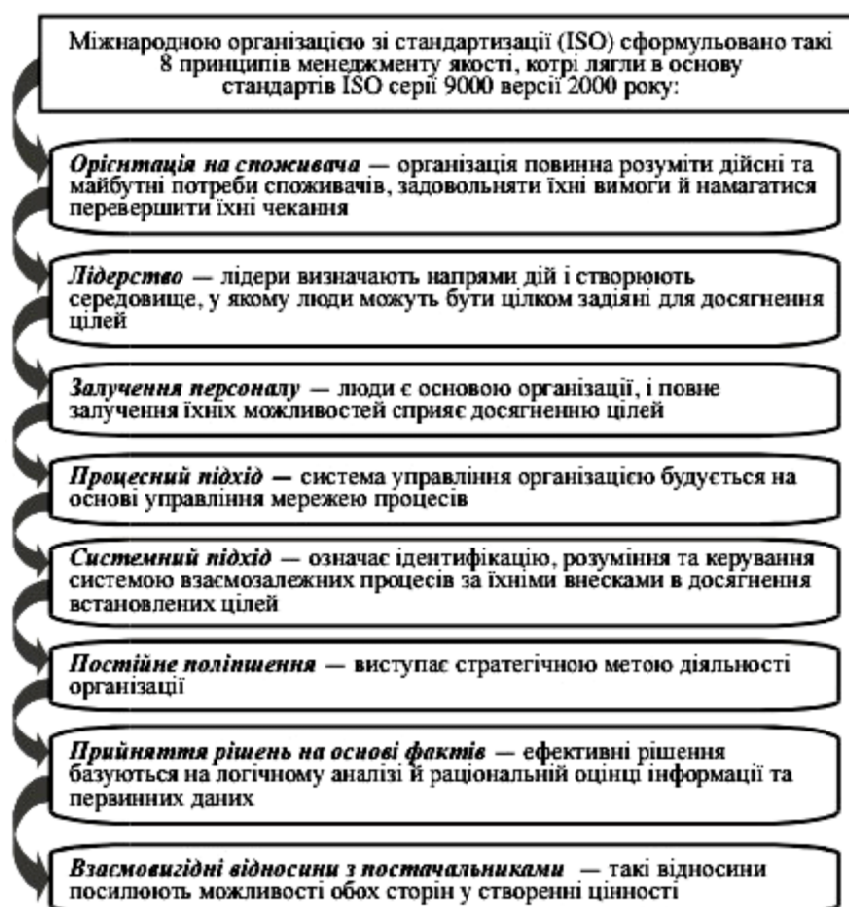
Рис. 2. Сучасні принципи менеджменту якості