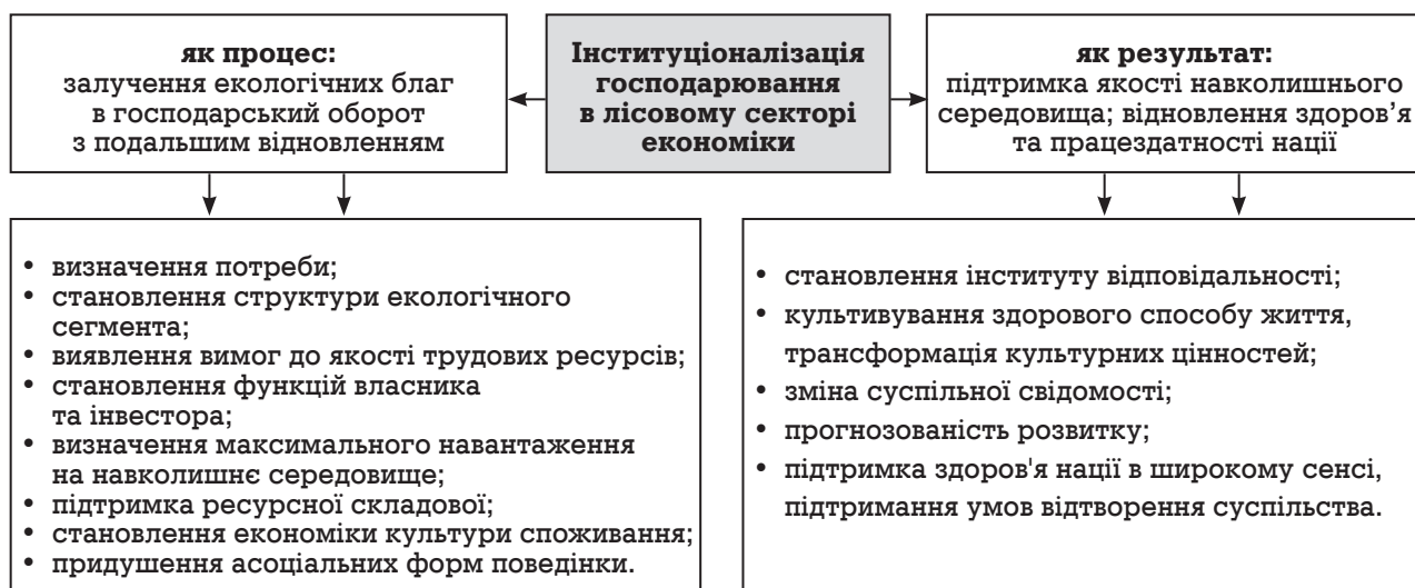
Рис. 2. Структурна схема інституціоналізації господарювання в лісовому секторі економіки

• несуперечність параметрів інститутів інституційної структури з метою запобігання виникнення інституціональних пасток, що призводять до втрат. Одним з інструментів реалізації даної умови виступає система моніторингу, яка забезпечує своєчасність передачі отриманої інформації, що дозволяє прийняти оперативні та адекватні заходи відповідно із сформованою ситуацією. В якості похідного показника може виступати відображення в господарських політиках суб'єктів необхідності створення системи моніторингу та інформування громадськості про відповідність показників діяльності