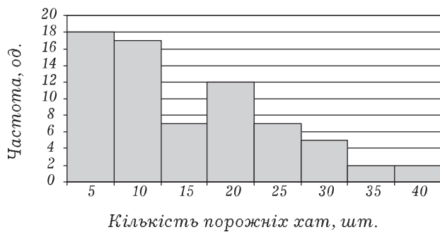
Рис. 1. Гістограма розподілу кількості порожніх хат на сільських територіях району