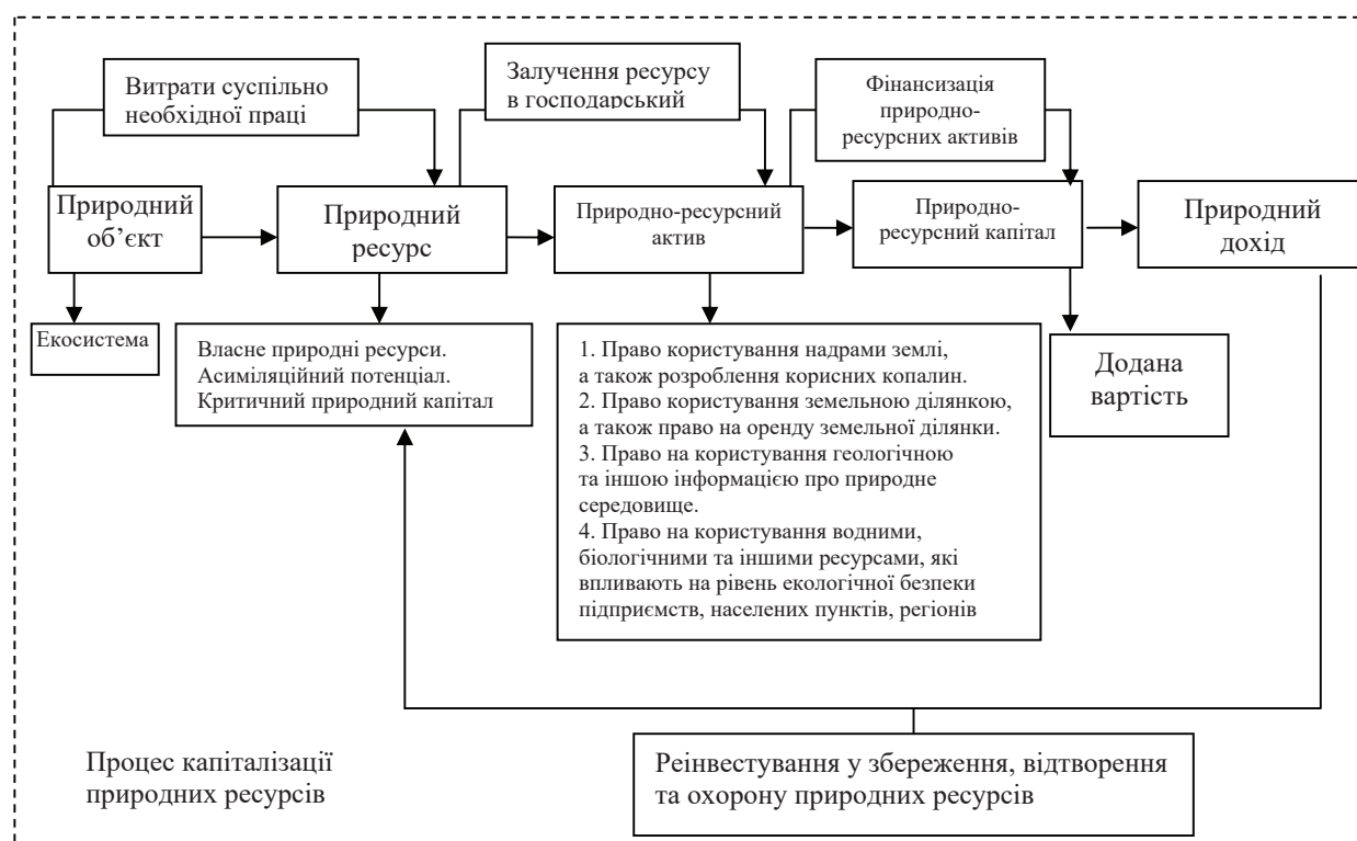
Рис. 2. Алгоритмізована схема процесів капіталізації та фінансування лісових ресурсів

у Великій Британії) доцільно віднести формування належної інформаційної бази, в якій відображалась би інформація щодо якісного та кількісного складу лісоресурсних активів території, а також динаміки їх вичерпання та відновлення, а з іншого боку — щодо зацікавлених сторін у лісокористуванні, чиї інтереси представлені на території, із зазначенням того обсягу правомочностей, якими конкретний користувач володіє в даний момент.