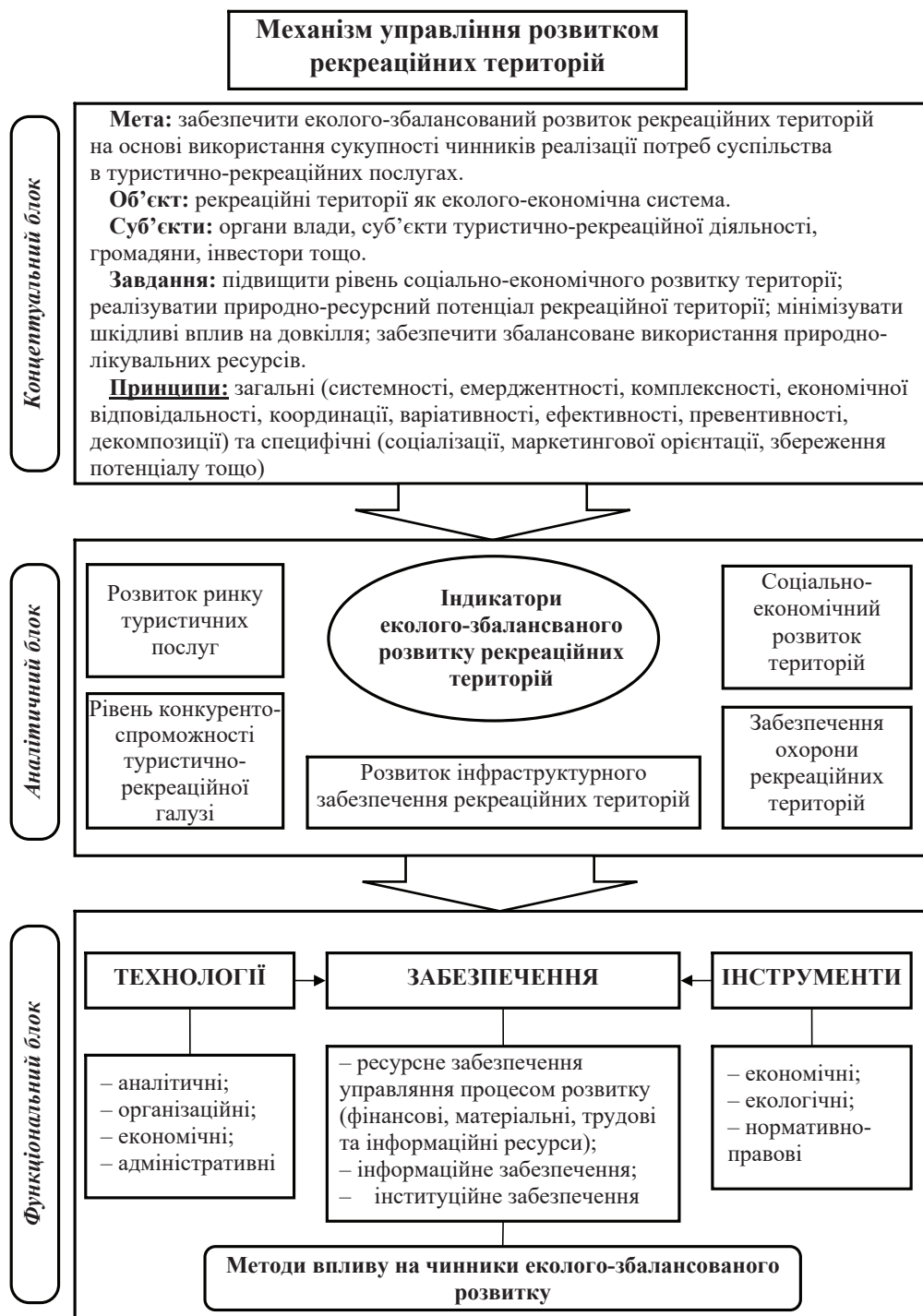
Рис. 1. Структура механізму еколого-збалансованого розвитку рекреаційних територій

ною галуззю; впровадження механізмів відповідальності за досягнення цільових індикаторів еколого-збалансованого розвитку.