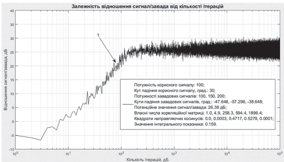
Рис. 5. Залежність відношення сигнал/завада від кількості ітерацій для заводової ситуації №4 з табл. 1 і табл. 3

Залежність відношення сигнал/завада від кількості ітерацій для заводової ситуації №4 з табл. 1 та табл. 3 наведено на рис. 5.