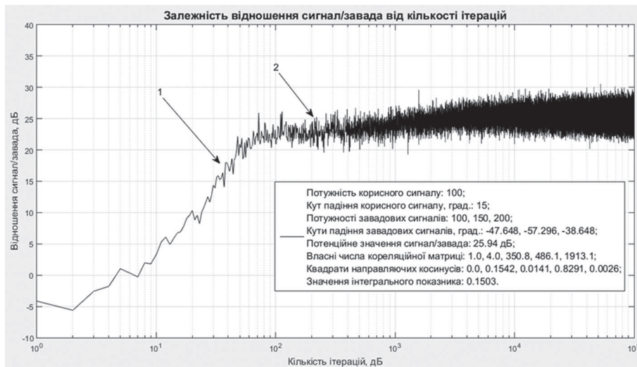
Рис. 4. Залежність відношення сигнал/завада від кількості ітерацій для заводової ситуації №3 з табл. 1 і табл. 3

Аналіз даних, наведених на рис. 4, дає можливість стверджувати, що на перехідні процеси вплив мають тільки друге та четверте власні числа, що становлять відповідно 4,0 та 486,1. Це зрозуміло з аналізу квадратів напрямних косинусів оптимального вагового вектора на відповідні власні вектори — 0,1542 та 0,8291. Наочно видно з рис. 4, що ділянка 1 відповідає четвертому власному числу, яке має найбільшу швидкість налаштування, тоді як ділянка 2 відображає фазу процесу налаштування, що визначається другим власним числом. Цілком зрозуміло, чому значення синтезованого інтегрального показника для цієї заводової ситуації зросло до 0,1503 порівняно з попередньою заводою ситуацією.