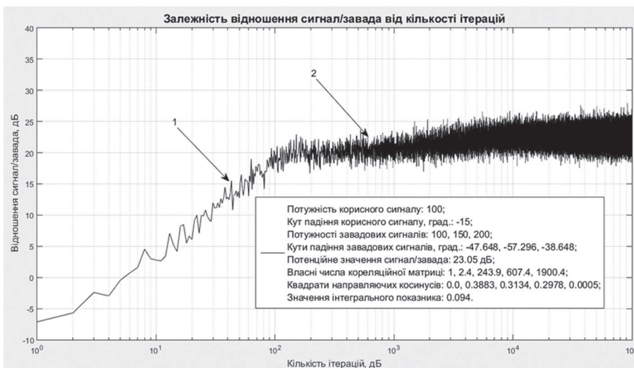
Рис. 3. Залежність відношення сигнал/завада від кількості ітерацій для завадової ситуації №2 з табл. 1 і табл. 3

Залежність відношення сигнал/завада від кількості ітерацій для завадової ситуації №2 з табл. 1 та табл. 3 ілюструє рис. 3.