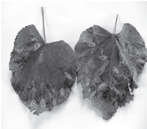
Рис. 1. Тип пошкодження (мінування) гусеницями Phyllonorycter issikii Kumata листків липи серцелистої

Визначення ступеня пошкодження липи серцелистої мілью-строкаткою проводили у першій декаді вересня.