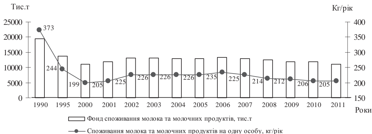
Рис. 1. Динаміка фонду та обсягів споживання молока і молокопродуктів (у перерахунку на молоко) у 1990–2011 рр