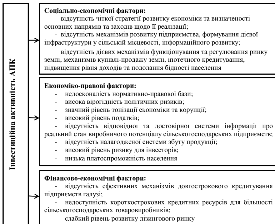
Рис. 1. Фактори, що негативно впливають на інвестиційну активність в АПК

викликає певне нерозуміння з боку іноземних інвесторів, насамперед щодо питань розвитку підприємництва, формування дієвої інфраструктури у сільській місцевості, інформаційного розвитку, започаткування купівлі-продажу землі, іпотечного кредитування, підвищення рівня доходів та подолання бідності населення.