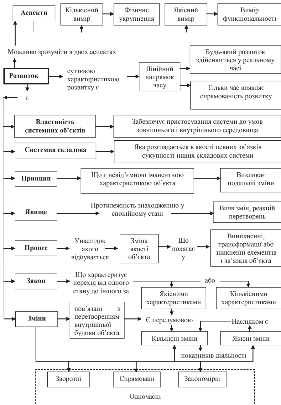
Рис. 3. Узагальнена характеристика розвитку як наукової категорії