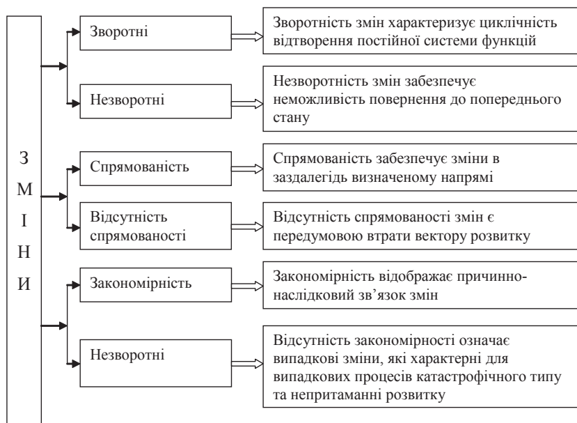
Рис. 2. Властивості розвитку

Джерело: розроблено автором на основі опрацювання наукової літератури.