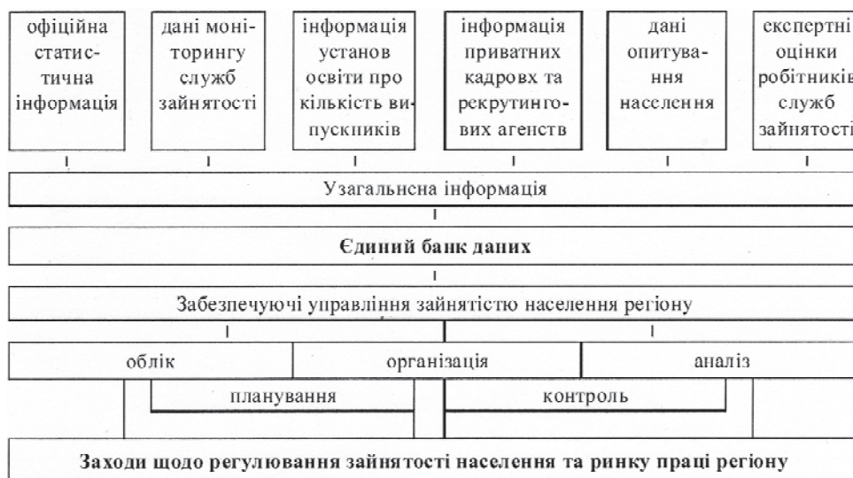
Рис. 1. Управління зайнятстю населення регіону